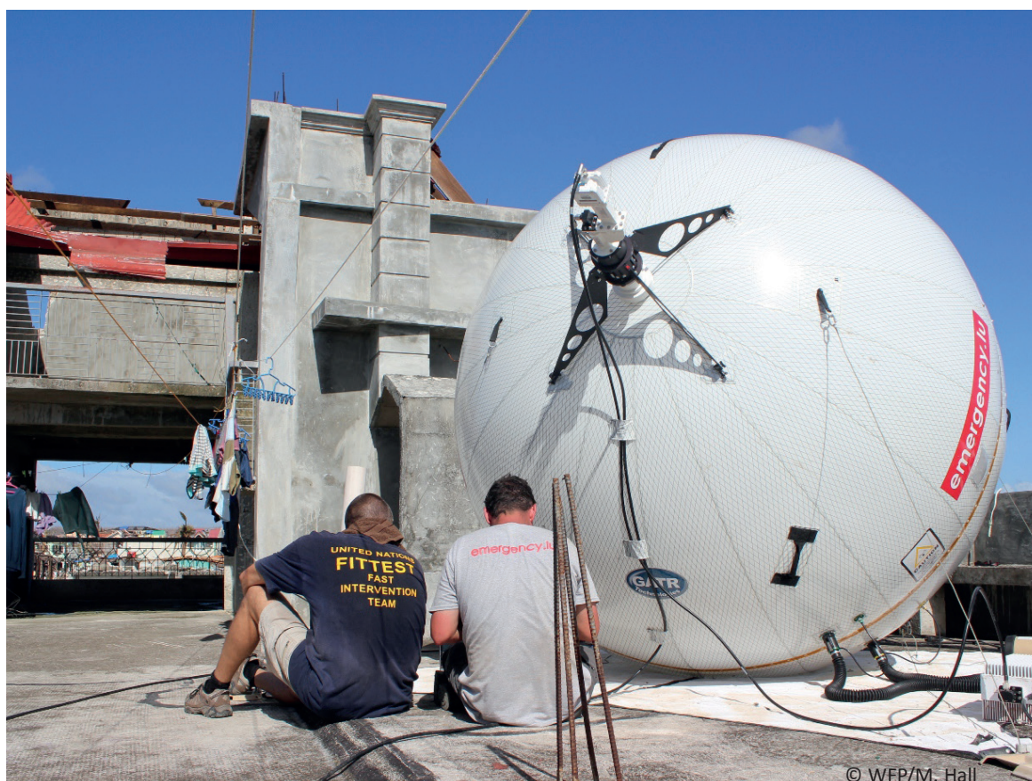
► PHILIPPINES | Intervention à Guiuan suite au Typhon Haiyan

Sur base de son expertise dans le domaine des TIC, le Luxembourg facilitera le transfert de connaissances et de technologies à des fins humanitaires et de développement. La Coopération luxembourgeoise poursuivra la mise à profit de l'expertise du Luxembourg en tant que centre spécialisé dans les TIC et favorisera dans ce domaine, les partenariats public-privé au service du développement.