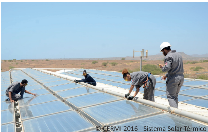
©-CERMI 2016 - Sistema Solar Térmico

CABO VERDE | Projet CVE/083 - Énergies renouvelables