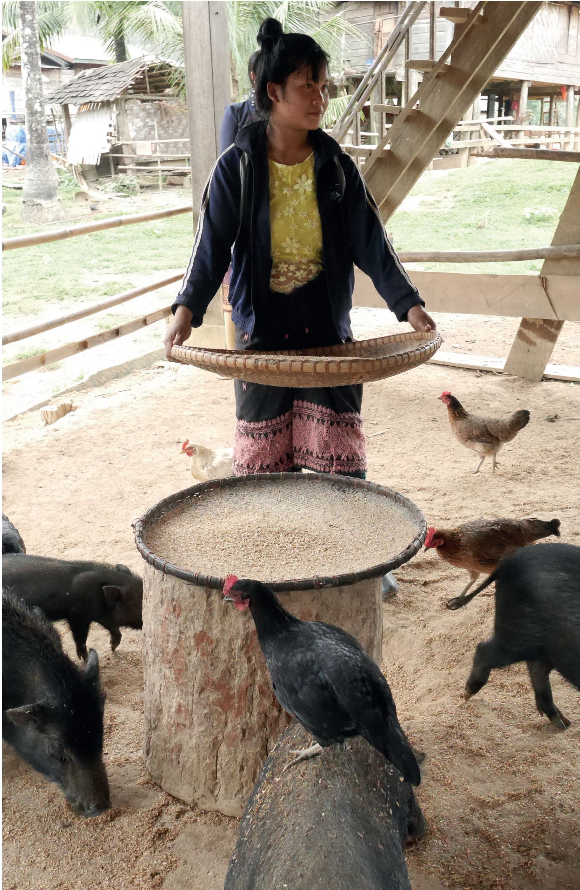
▶ LAOS | Projet LAO/030 - Programme de développement local pour les provinces de Bokeo, Bolikhamxay, Khammouane et Vientiane