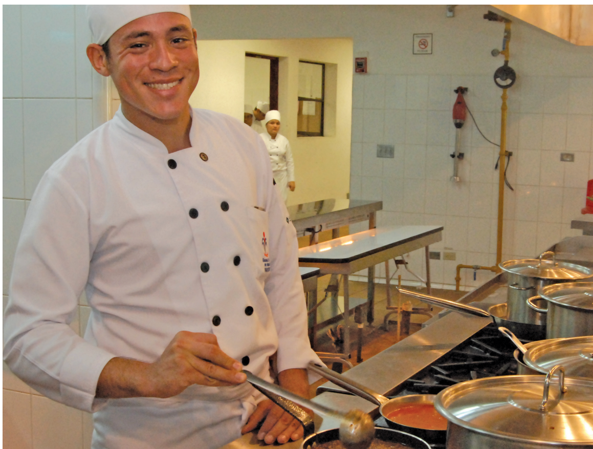
► NICARAGUA | Projet NIC/026 - Renforcement institutionnel de la formation professionnelle en hôtellerie, tourisme et industrie