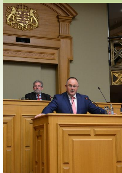
@Chambre des députés