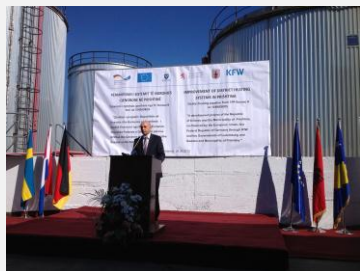
M. Isa Mustafa, Maire de Pristina

Le début des travaux du projet Termokos « Amélioration du réseau de chauffage urbain de Pristina » a officiellement débuté par une cérémonie le 26 septembre 2013 à Pristina. Le projet vise la réhabilitation du système de chaleur urbaine de Pristina en utilisant l'énorme surplus de chaleur produit par la centrale thermoélectrique d'Obiliq. Le Luxembourg contribuera avec 1.5 million d'euros au budget total d'environ 30 millions euros qui sera cofinancé par l'UE, la KfW, la municipalité de Pristina et la Suède.