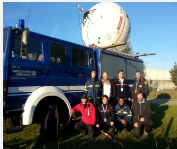
Antenne Emergency.lu et l'équipe ETC Team pour Sydland