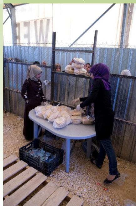
Jordanie, Za'atari, Camp de réfugiés

Le Conseil de sécurité des Nations Unies a adopté le 2 octobre une déclaration présidentielle sur la situation humanitaire en Syrie. Le projet de texte avait été soumis par le Luxembourg et l'Australie, qui ont activement travaillé au cours des derniers mois avec l'Office pour la coordination des affaires humanitaires de l'ONU (OCHA), avec le Haut-Commissariat aux Réfugiés de l'ONU (UNHCR) et avec d'autres agences pour proposer un texte qui soutient les efforts entrepris pour améliorer l'acheminement de l'aide humanitaire et l'accès aux populations affectées en Syrie.