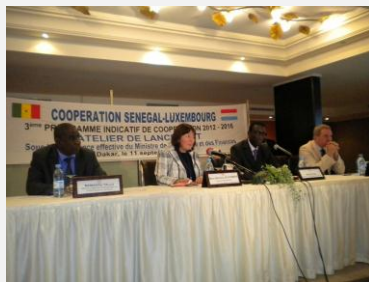
Atelier de lancement du PIC III