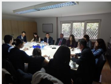
La réunion des bailleurs de la santé dans la nouvelle salle de réunion de l'Ambassade