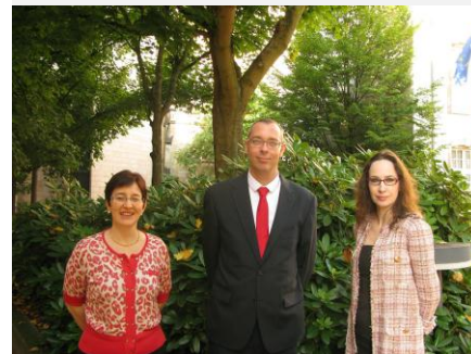
Les nouveaux collègues de la Direction de la coopération

Dans le cadre du recrutement de jeunes qui souhaitent s'engager dans la coopération au développement, la Direction de la coopération a procédé ensemble avec différentes agences onusiennes à l'engagement de 7 JPO (Junior Professional Officer) et avec LuxDev à l'engagement de 5 ATJ (Assistant Technique Junior).