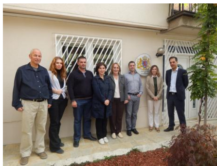
L'équipe de Pristina

Pour résoudre la pénurie massive d'eau dans la ville kosovare de Vushtrri, les ingénieurs du projet KSV/016 Institutional and Technical Support for the Water Supply System in Mitrovica ont proposé de construire une conduite d'eau directe entre la station d'épuration de Shipol et la ville de Vushtrri. Le Ministère des Finances kosovar cofinance à hauteur de 150.000 € ces travaux qui seront exécutés par LuxDev.