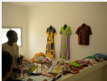
Louga – Formation professionnelle