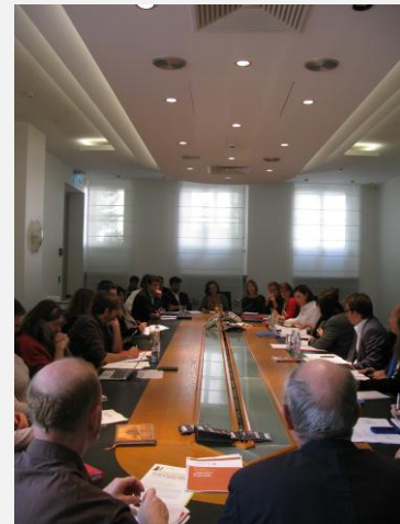
Table-ronde MAE - ONG pour préparer les consultations à New York

Le vendredi 20 septembre, environ 30 représentants d'ONG, des représentants de la Direction de la coopération et une représentante du ministère du Développement durable et des Infrastructures se sont réunis à l'Hôtel St Augustin.